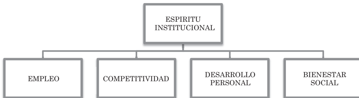
Figura 1. Efectos en el espíritu Institucional

En este mismo orden de ideas, el espíritu institucional es considerado como la capacidad o habilidad para hacer realidad una oportunidad de crecimiento. En los organismos públicos se acentúa la posibilidad de promover dicho espíritu, a través de la formación desde los niveles educativos primarios; es decir, en la escuela, hasta los niveles superiores en la universidad (Urbano, 2008). En cuanto al desarrollo personal, este autor asegura que se facilita la satisfacción de las necesidades más elevadas del capital humano en el campo laboral, como la realización propia, la independencia, reflejando además motivación y capacidad para identificar y perseguir oportunidades, tal como se muestra en la figura 1. Afirmando además que el espíritu institucional formará parte de la vida de los empleados.