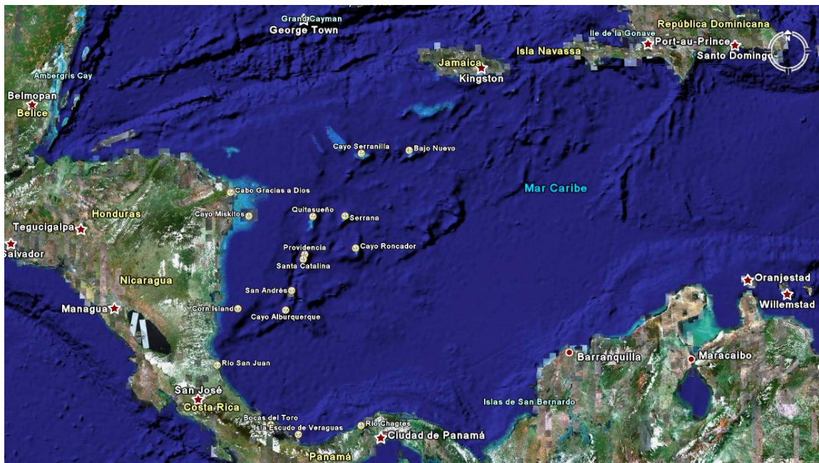
Mapa 1. Delimitación territorial del conflicto.

El proceso contencioso que Nicaragua adelanta ante la Corte Internacional de Justicia en contra de Colombia, comprende el Archipiélago de San Andrés, Providencia Y Santa Catalina, - sobre estos determinó la corte que no se iba a pronunciar en la sentencia de fondo.- Y demás cayos, islas e islotes que lo conforman; también el territorio marítimo limítrofe entre ambos países. Por esta razón se describirá el área involucrada en el conflicto, que es necesario detallar para un mejor conocimiento del marco en que se desarrolla este (ver mapa 1).