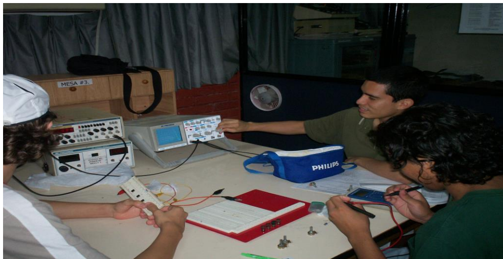
Utilización de los instrumentos y herramientas básicas empleadas por los estudiantes durante la realización de una práctica en el laboratorio de electrónica.