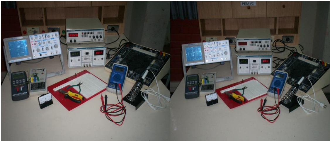
Herramientas e Instrumentos básicos disponibles en el laboratorio de electrónica