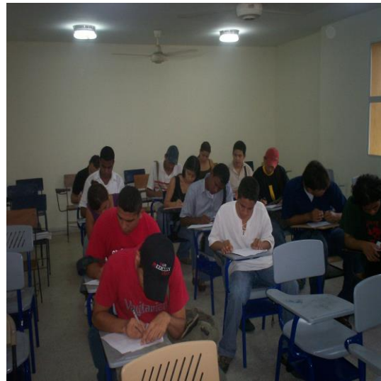
Encuesta realizada a los estudiantes pertenecientes al programa de Ingeniería Electrónica