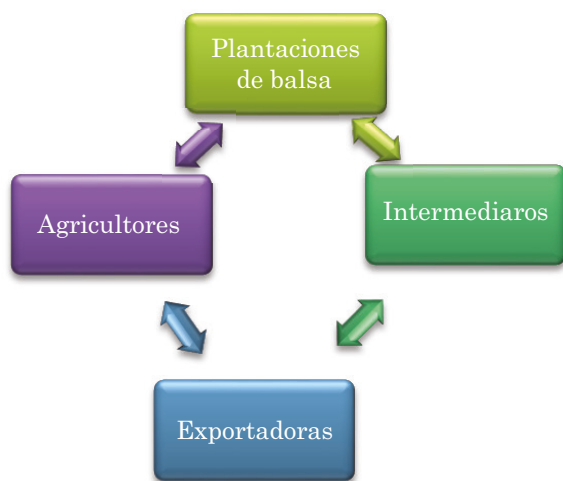
Figura 1. Tipos de productores de balsa para la exportación

Por otro lado en función del nivel de participación en las actividades relacionadas con el aprovechamiento de madera aserrada, ya sea dura o blanda, en la zona de producción se han identificado los siguientes agentes en la cadena de comercialización de madera aserrada: productor – aserrador / intermediario – comerciante transportista y depósito, ya sea en el mercado local o fuera de la región, como se ilustra en la siguiente figura. (Donoso, 2012)