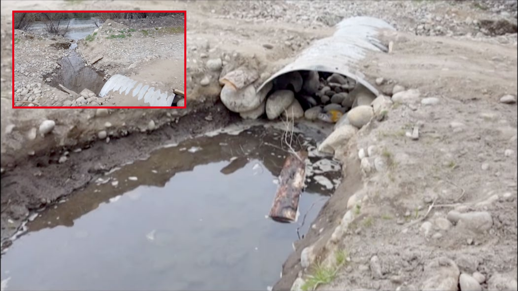
Fig. 1. Junin de los Andes.