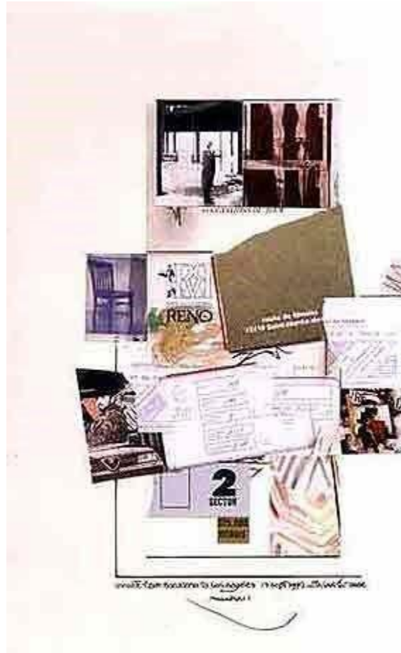
Figura 2. Meier, 1995

yuxtaposicionar dos retículas una encima de la otra, de las cuales una se alinea con el borde de la base utilizada y a la otra le da un giro con respecto de la otra de 5 grados.