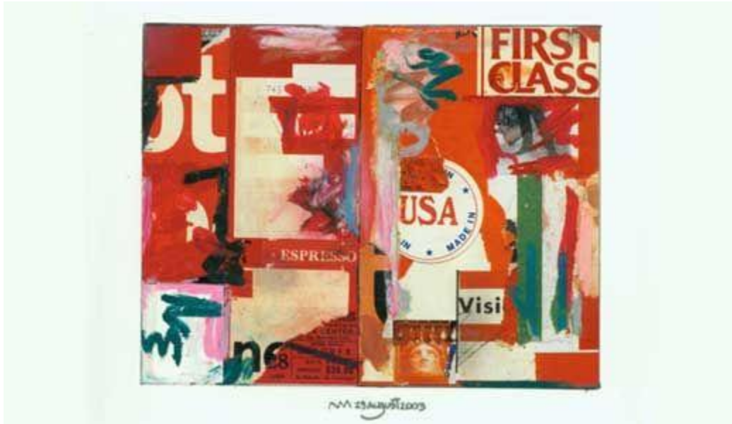
Figura 5. Meier, 1998

cierto modo quedan subyugadas por la misma. Y se crean capas distintas. Estas capas visuales expresan la zonificación funcional, las divisiones de las distintas salas de exposición y los espacios de circulación y recorridos. (Dahabreh, THE FORMULATION OF DESIGN: THE CASE OF THE ISLIP COURTHOUSE BY RICHARD MEIER, 2006)