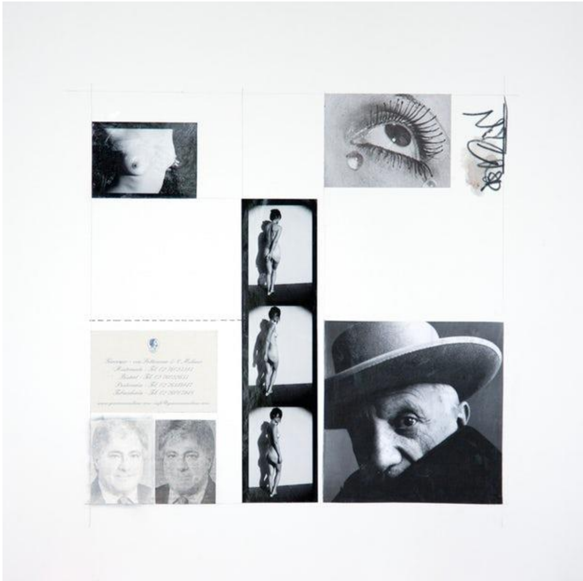
Figura 4. Meier, Giacomo II, 2012