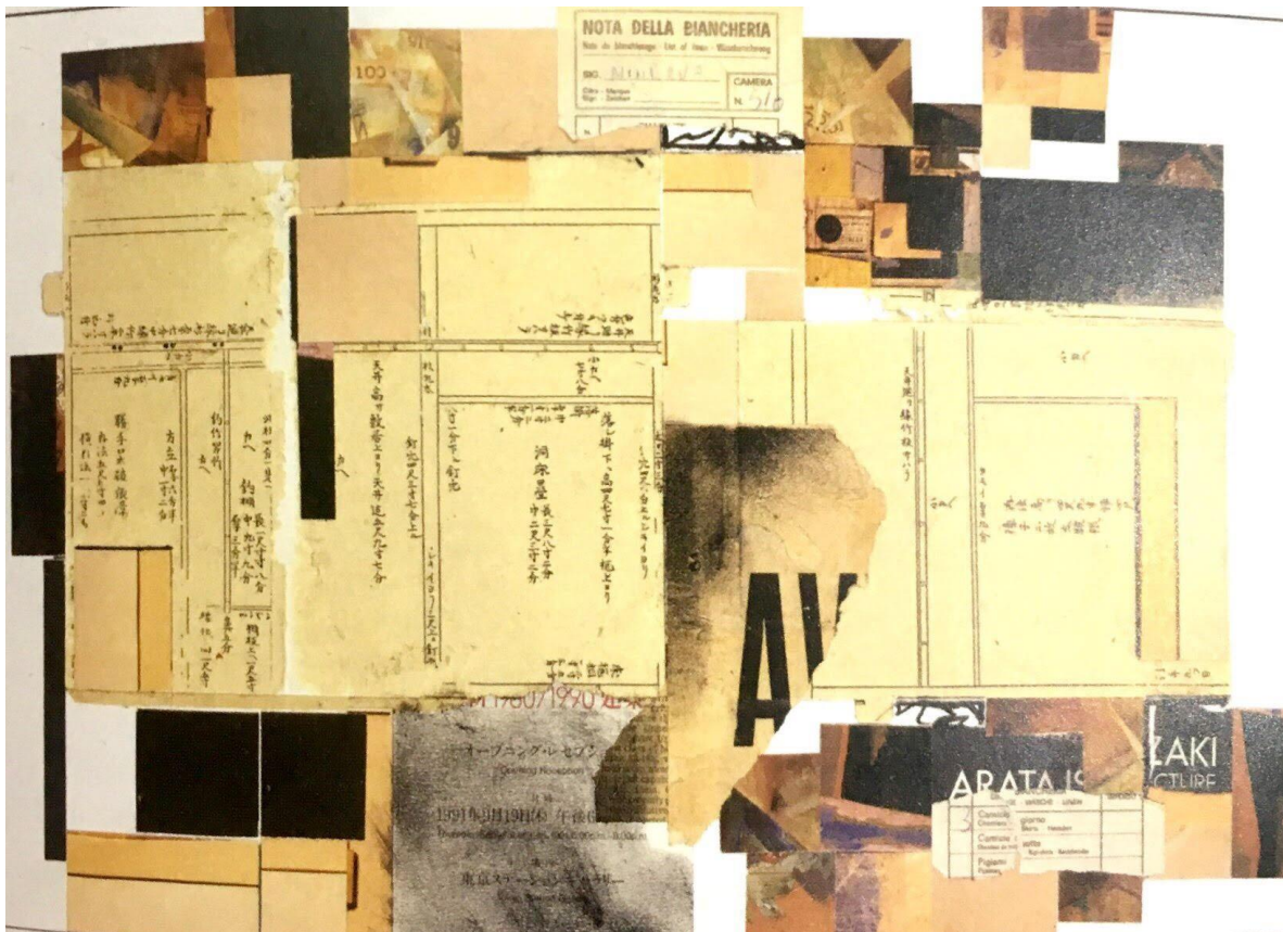
Figura. 1. Meier, Nota della Biancheria,1992

un elemento de organización estructural y no metodológico como es utilizada por Meier, quien interpreta la retícula como una herramienta de carácter proyectual. Esta herramienta proyectual, podría considerarse un sistema reticular, se ha desarrollado en tres variables distintas, como lo son, la retícula sobre curvas, la retícula ortogonal y las retículas yuxtapuestas con giros. (Ovando, 2018) Al analizar los collages realizados por Meier, también encontramos el uso de un sistema de retícula en estas tres variables y que se logran evidenciar en sus obras artísticas.