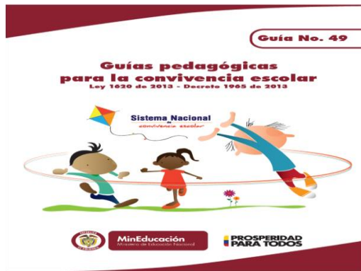
Figura n 1: Guía pedagógica para la convivencia escolar Tomado de: Ley 1620 de 2013. Ministerio de Educación Nacional