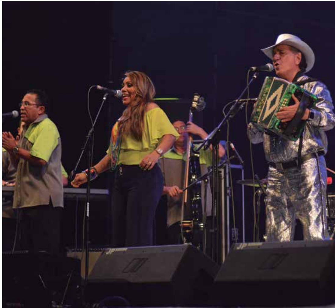
Homenajeado en el Carnaval 2016, el artista estuvo en los principales bailes de la fiesta durante la temporada.

Contó con la suerte de que en la fiesta se hallaba el gerente de la casa disquera Sonolux, a quien le gustó su actuación y lo invitó para que grabara el tema Cantinero, sirva trago . Algunos bautizaron la canción como Parranda en Tecnicolor . Y esto no es raro que