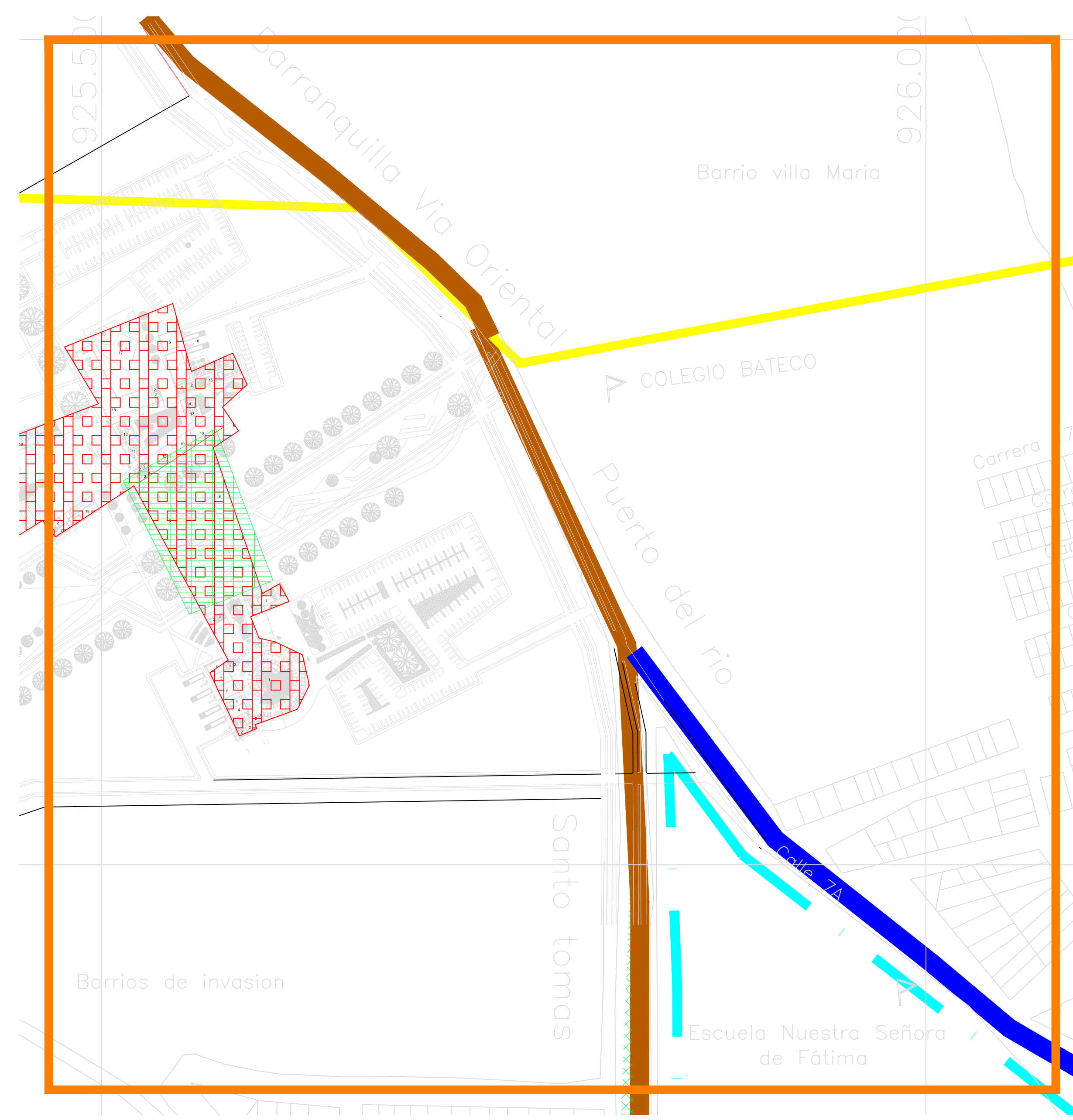
1 LOCALIZACION DEL AREA DE TRABAJO ESCALA: 1 : 2000