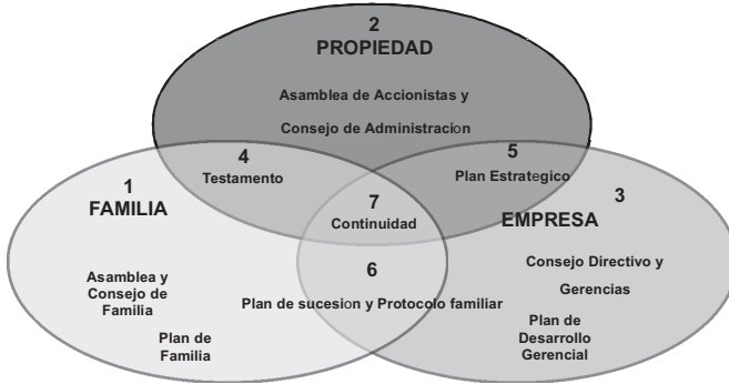
Gráfico 3 Estructura y planes de gobierno corporativo