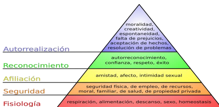
Figura 1.2 Pirámide de jerarquización de las necesidades

En la zona inferior se puede encontrar las necesidades más básicas para la vida, a medida que sube escalones, se ira encontrando con otro tipo de comportamientos menos necesarios hasta llegar a la punta, donde se encuentra la famosa autorrealización a la que todo ser humano aspira llegar algún día, con ello, a la felicidad plena, como refleja la figura 1 y se divide la pirámide en la siguiente jerarquización: