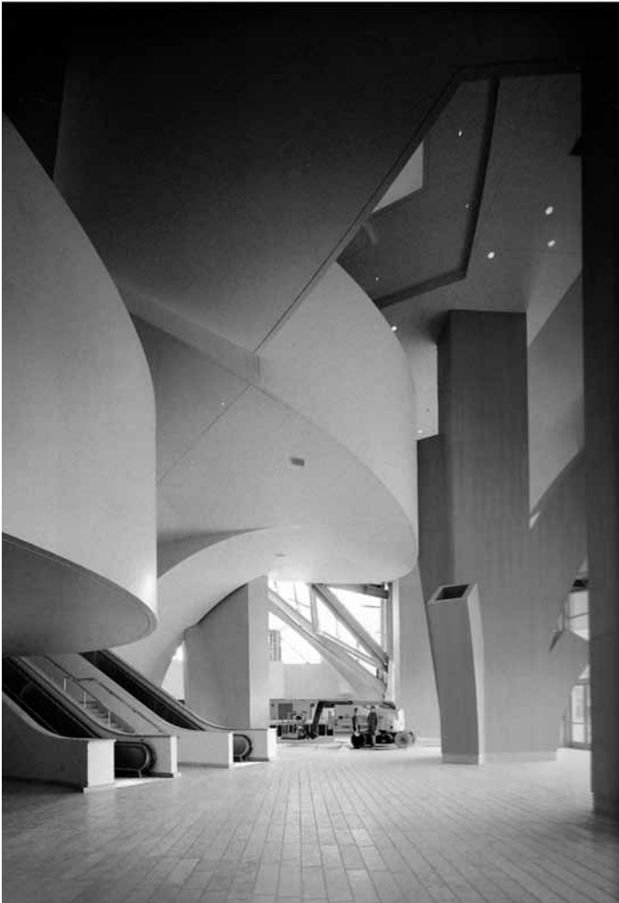
Auditorio Walt Disney. Los Ángeles, California.

clamación estética con un fuerte y claro discurso. En su proceso de diseño desarrolla un exhaustivo modelado del espacio físico en múltiples escalas para explorar los distintos niveles de detalle. Estos modelos no sólo exploran la funcionalidad del espacio particular y de todos los espacios en conjunto, sino que a su vez busca manipular las cualidades escultóricas utilizando en los modelos a escala los mismos materiales con los cuales se construirá el proyecto futuro. Así mismo, Scardamaglia afirma que ese proceso de creación, de gestación formal del objeto arquitectónico se apoya en procesos artísticos y estéticos en la búsqueda de nuevas formas, espacios y superficies, que puedan ofrecerle a la sociedad un medio de vivir mejor, de vivir estéticamente (Scardamaglia, 2010).