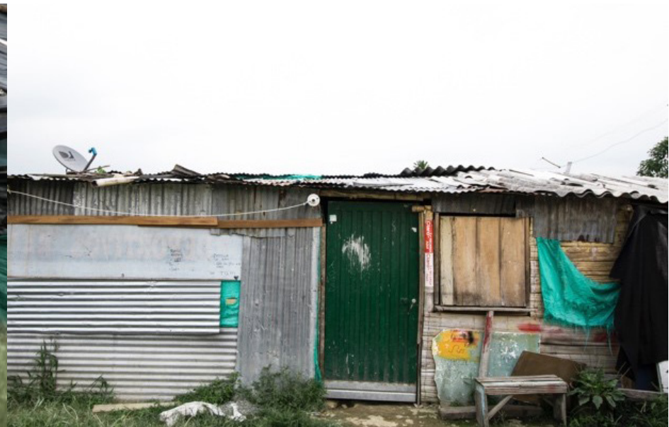
Fig. 3. Lenguaje: El Plumón.