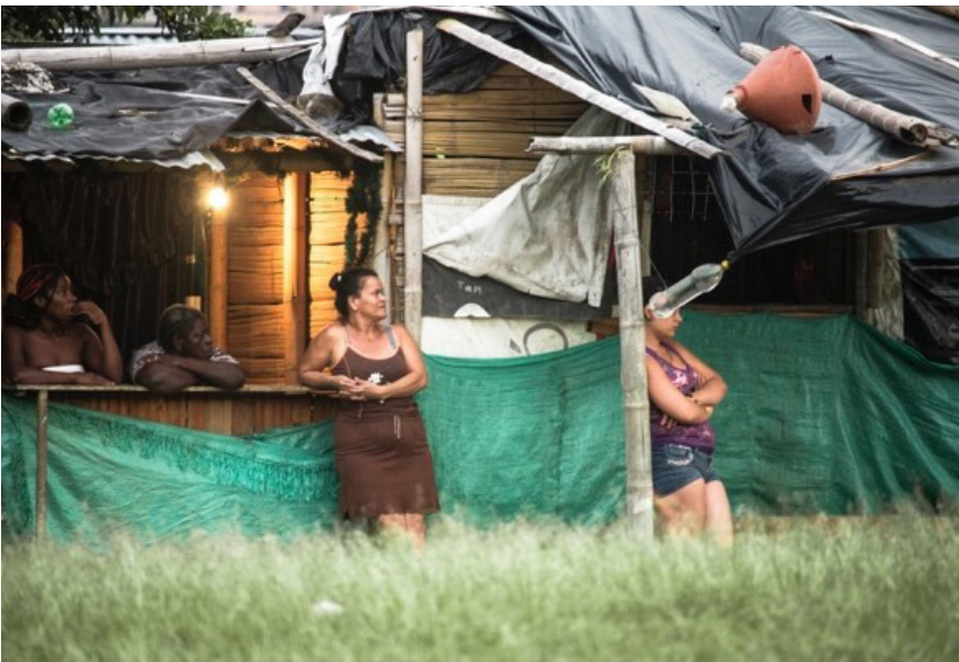
Figura 2. Comunidad El Plumón.