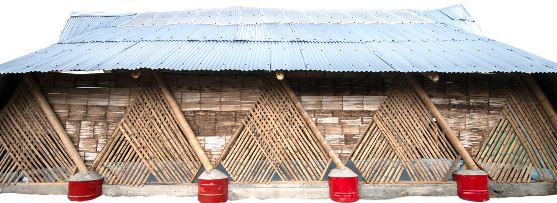
▲ Fig. 6. Casa Ensamble Chacarrá.