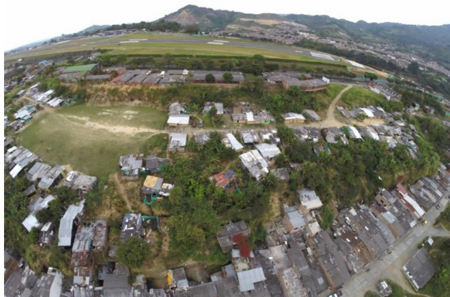
Figura 1. Fotografía aérea de El Plumón

Sin reconocimiento, sin convivencia, sin colectividad y sin gobierno no existe lo común, no existen escuelas, escenarios culturales o centros comunitarios; lo público son las calles maltrechas y los