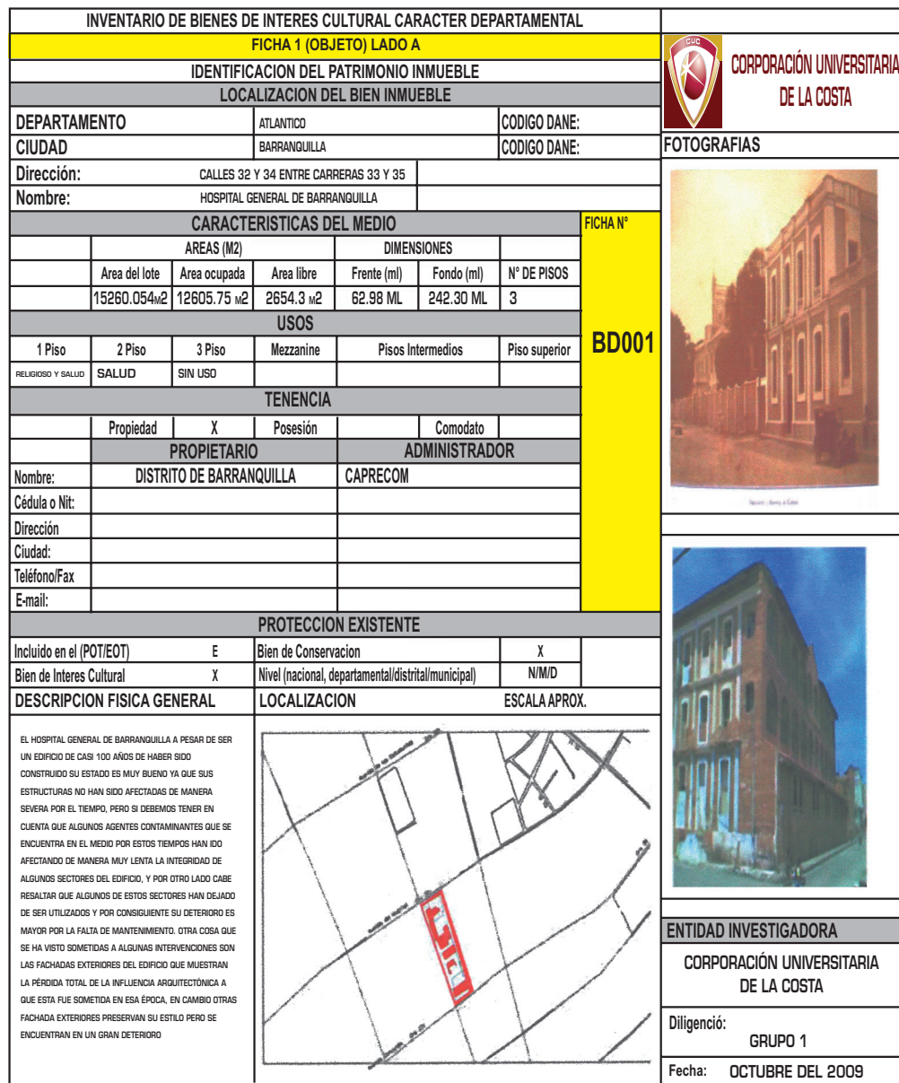
Figura 3. Ficha de identificación del inmueble 1