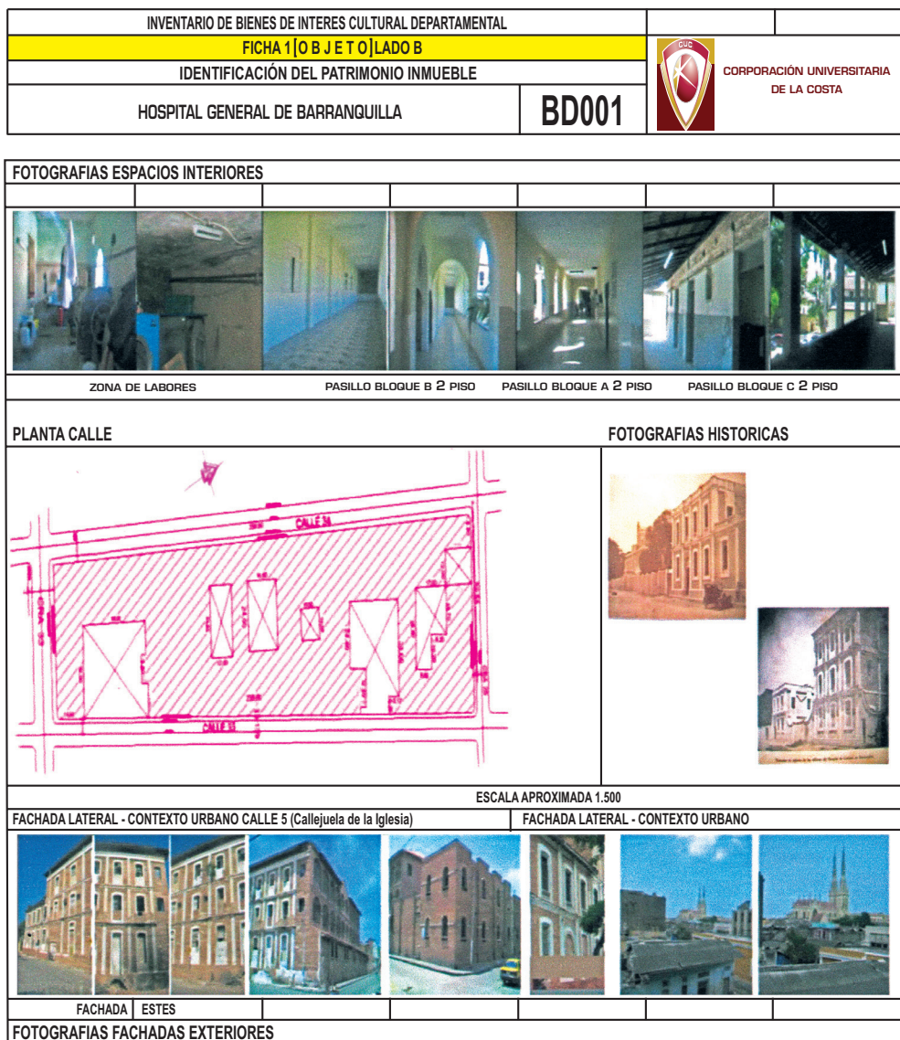
Figura 4. Ficha de identificación del patrimonio inmueble 2