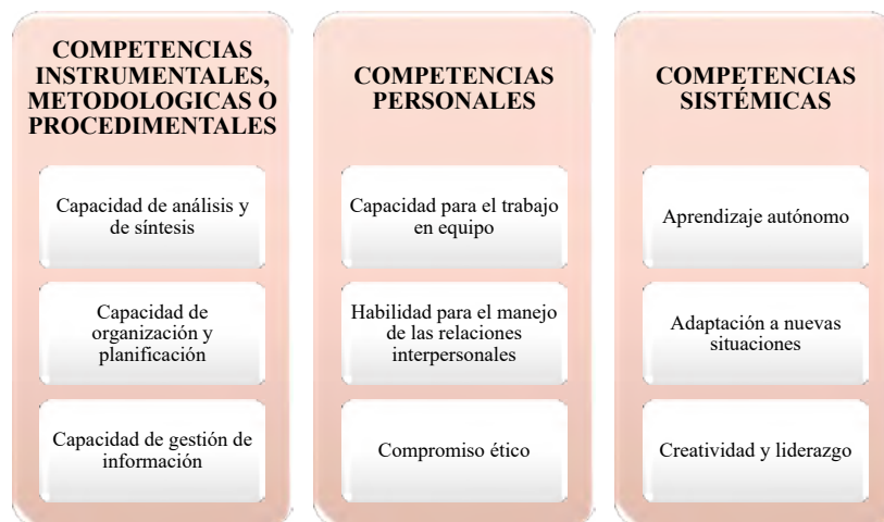
Figura 2. Clasificación de competencias de acuerdo al proyecto tuning

Un ejemplo de lo anterior es la propuesta de Perrenoud, citado por García (2011) el cual hace mención de diez grupos de competencias que el docente debe poseer para garantizar no la transmisión de éstas a los estudiantes sino más bien para propiciar los espacios para que ellos mismos tengan la oportunidad de construirlas, dichas competencias son descritas a continuación: