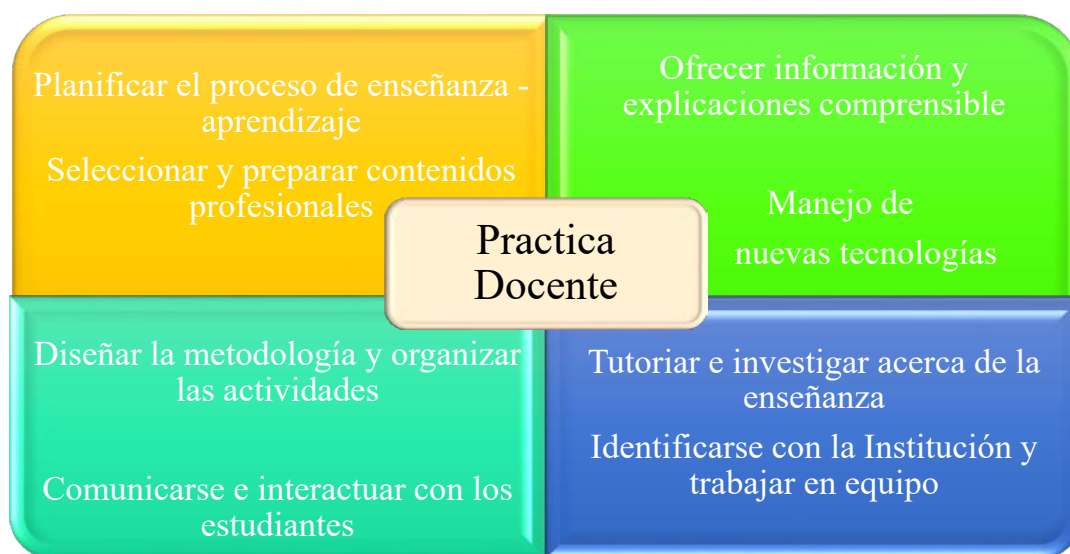
Figura 3. Competencias para la práctica docente

Otro de los autores que propone un perfil docente basado en competencias es Miguel Zabalza, citado por (Barrera & Rodríguez, 2012). Tal como se ve en la figura 2 se resalta la importancia de las siguientes competencias en la práctica docente.