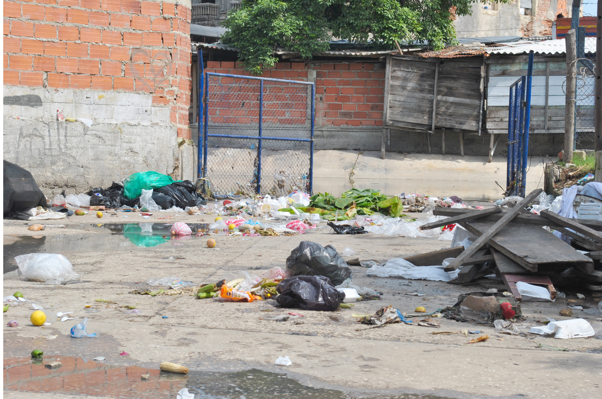
Figura 5. Bolsas plásticas y residuos sólidos en las calles

Un planteamiento muy acertado debido a que solo cuando se conozca adecuadamente cada uno de los materiales que se manipulan en el diario