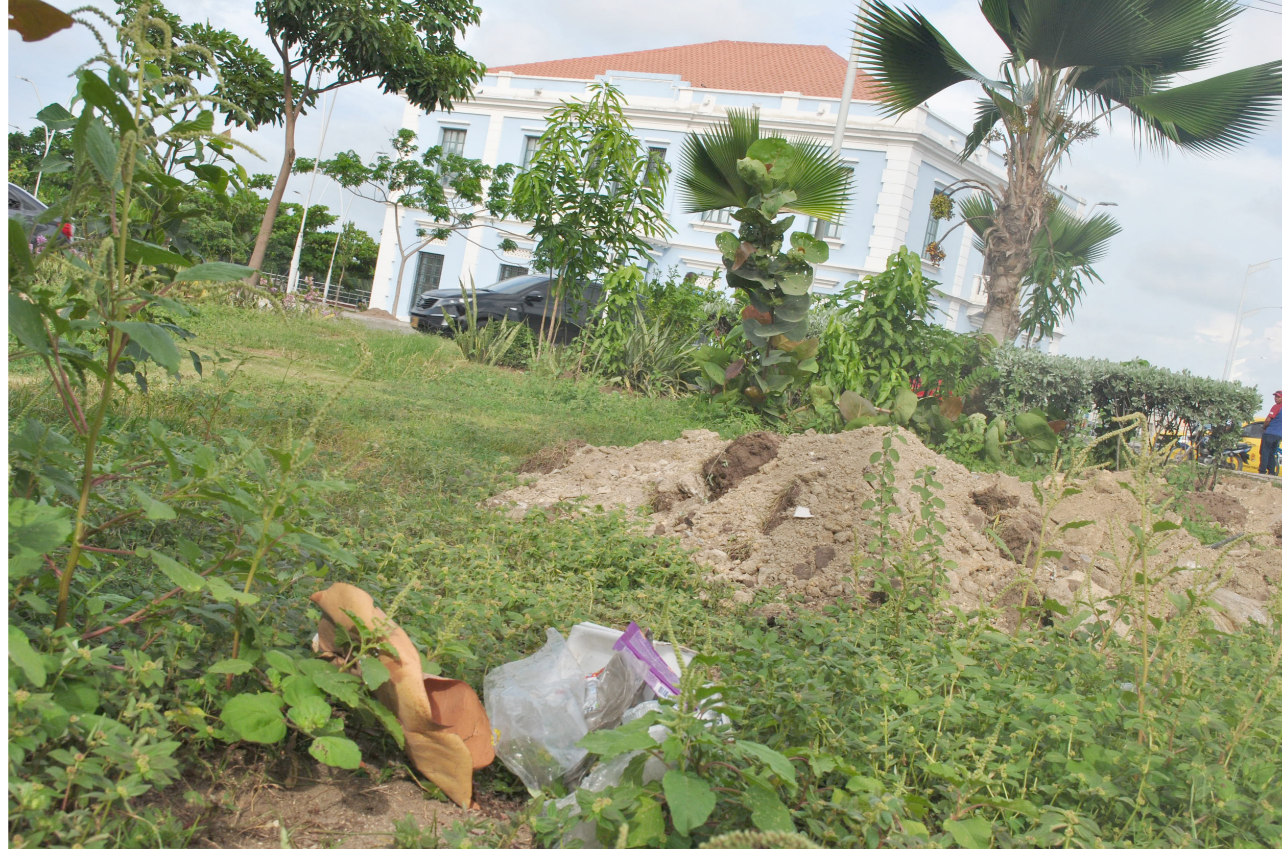
Figura 3. Lugares patrimoniales envueltos en el manejo inadecuado de los residuos

toneladas de basura, de las cuales el 96.8 % fueron a parar a los rellenos sanitarios (El Colombiano, 2017). Una situación alarmante debido a las graves problemática en materia de contaminación y cambio climático que enfrenta el planeta, además de no olvidar que el crecimiento poblacional es cada vez mayor y en unos pocos años ese depósito de desechos quedará pequeño ante la magnitud de los residuos generados a pesar que las políticas del país apunten a encontrar nuevos lugares para la disposición de estos, es más objetivo pensar en nuevas alternativas, amigables con el medio ambiente desde la arquitectura y que incorporen la utilización de los residuos en la cotidianidad, con el fin de presentar proyectos e ideas que puedan ser fáciles de replicar y de esta manera hablar de una verdadera sostenibilidad. Es por ello, que se hace un llamado al conocimiento, concepción, conceptualización, planeación, diseño y materialización de proyectos sostenibles, de principio a fin. Que generen cero emisiones y un impacto +1. Sí, es cierto que en la actualidad es común hablar de sostenibilidad en la cotidianidad de las diversas actividades; todas les apuntan a este concepto a raíz de la alarmante condición que está padeciendo el planeta, pero las medidas tomadas para combatir este son mínimas y dejan por fuera aspectos importantes y de gran impacto. Hay que permitir a los