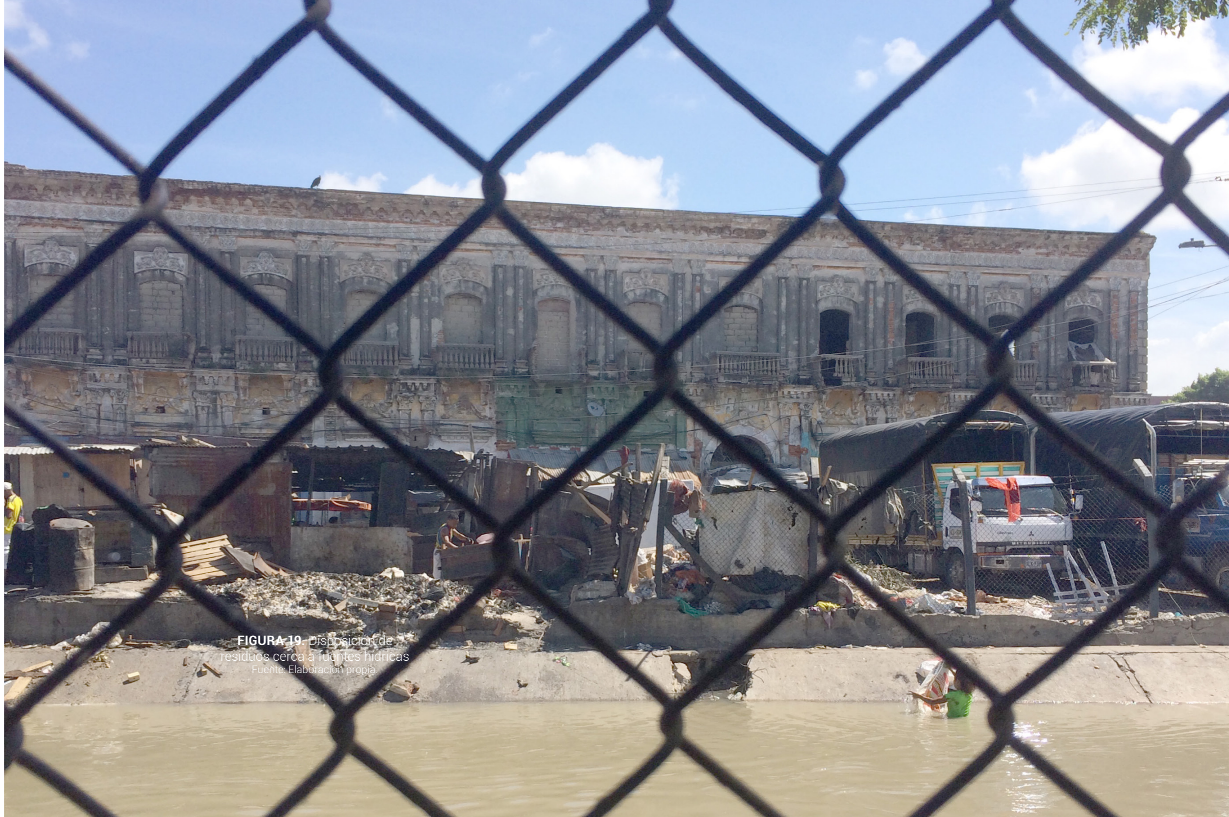
FIGURA 19. Disposición de residuos cerca a fuentes hídricas

Este trabajo se centra también solo en uno de los muchos ámbitos que pueden contribuir a una buena gestión de estos desechos como materia prima en la generación de hábitats urbanos. Planteamos la usabilidad de dichos materiales reciclados desde una perspectiva sostenible (en lo ambiental, lo social y lo económico), con una aplicabilidad en el diseño de los espacios en los que habita el hombre. Así pues, hablamos de la vivienda, los equipamientos e incluso del espacio público, pueden ser los escenarios de aplicabilidad de este proceso de reciclaje de residuos que van desde materiales que no son biodegradables hasta aquellos que tienen una composición que generan impacto negativo, si no se les da un tratamiento eficiente, ya que tardan mucho tiempo en descomponerse. En este sentido: