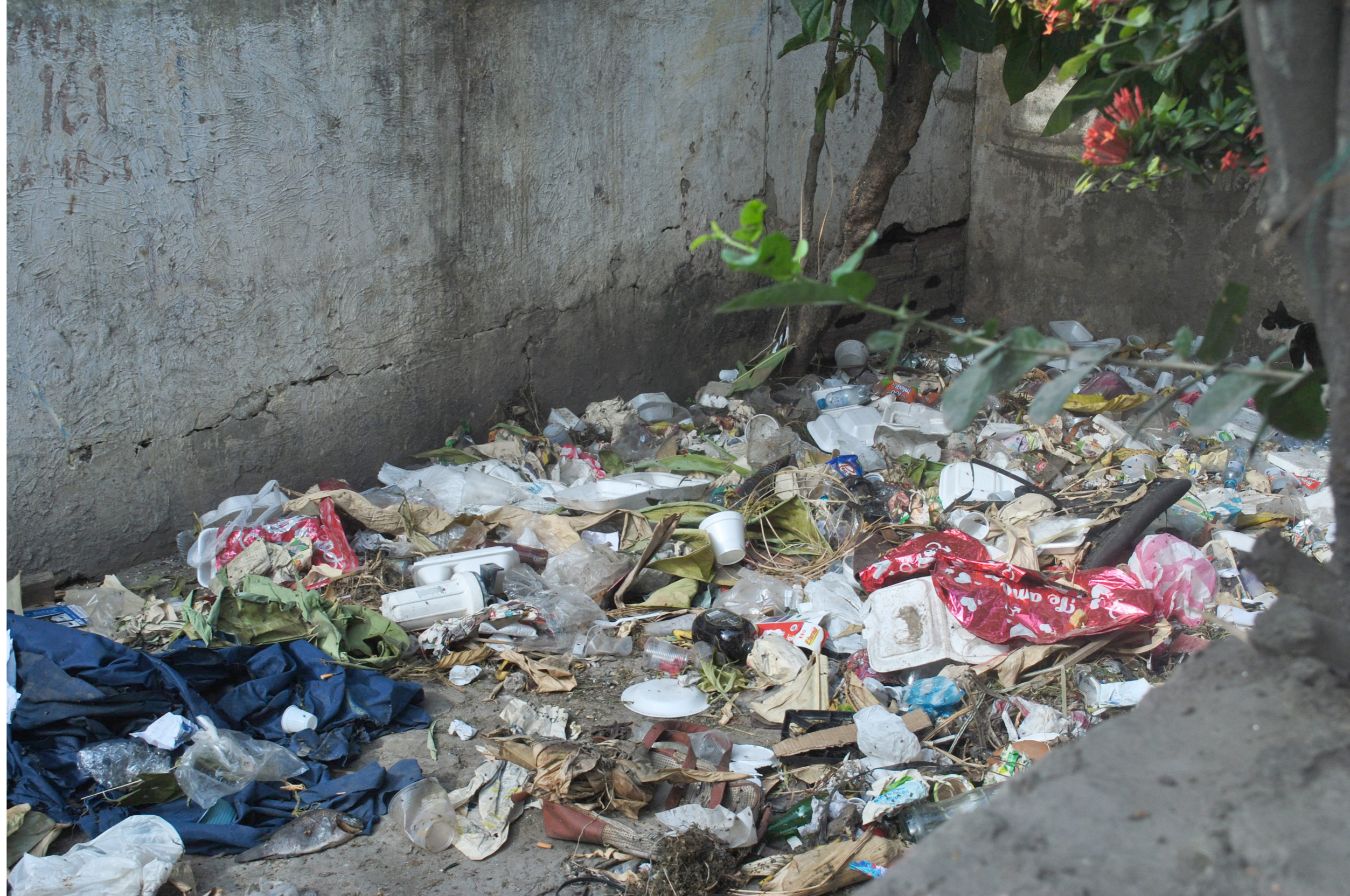
Figura 2. Manejo de los residuos en el centro histórico de Barranquilla

Para el caso de Colombia la generación y disposición de desechos se reduce a una frase “BOMBA DE TIEMPO” debido a que cada vez son más las noticias sobre la problemática de los rellenos sanitarios a cielo abierto donde muchas veces se convierten en noticias efímeras debido a que no nos afectan directamente a todos, sino a pequeñas poblaciones que pocas veces tiene voz y voto en esta importante y grave situación. Un estudio reciente de la Superintendencia de Servicios Públicos y el departamento Nacional de planeación, planteó que Colombia generó para el año 2015 9’967.844