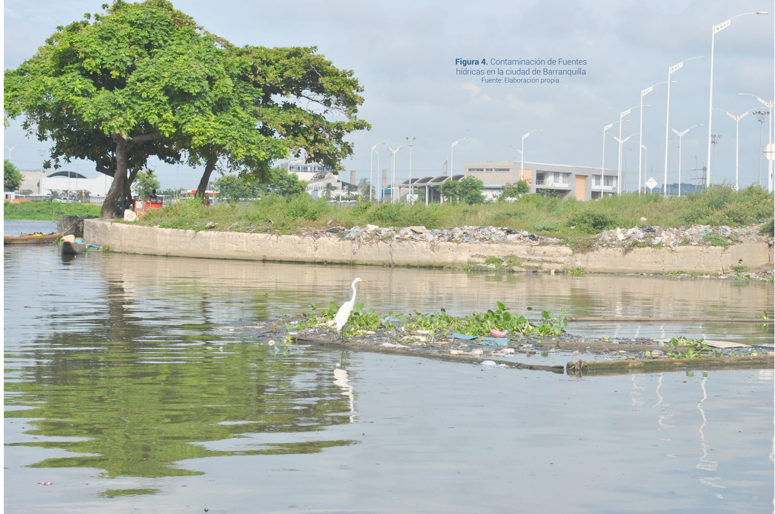
Figura 4. Contaminación de Fuentes hídricas en la ciudad de Barranquilla

¿Será posible evolucionar y hacer construcción, arquitectura, urbanismo y diseño de una manera limpia, sensible y consiente, que optimice cada recurso desde su concepción hasta su fin e incluso su evolución en el tiempo, teniendo el conocimiento de sus materiales, su comportamiento y la potencialidad que estos poseen a lo largo de su ciclo de vida, para que se aproveche al máximo cada una de sus cualidades?, porque lo valioso de estos procesos no es acumular y construir cosas es notar como cada pieza que parece dispersa, encontrara su función y uso a pesar de los cambios.