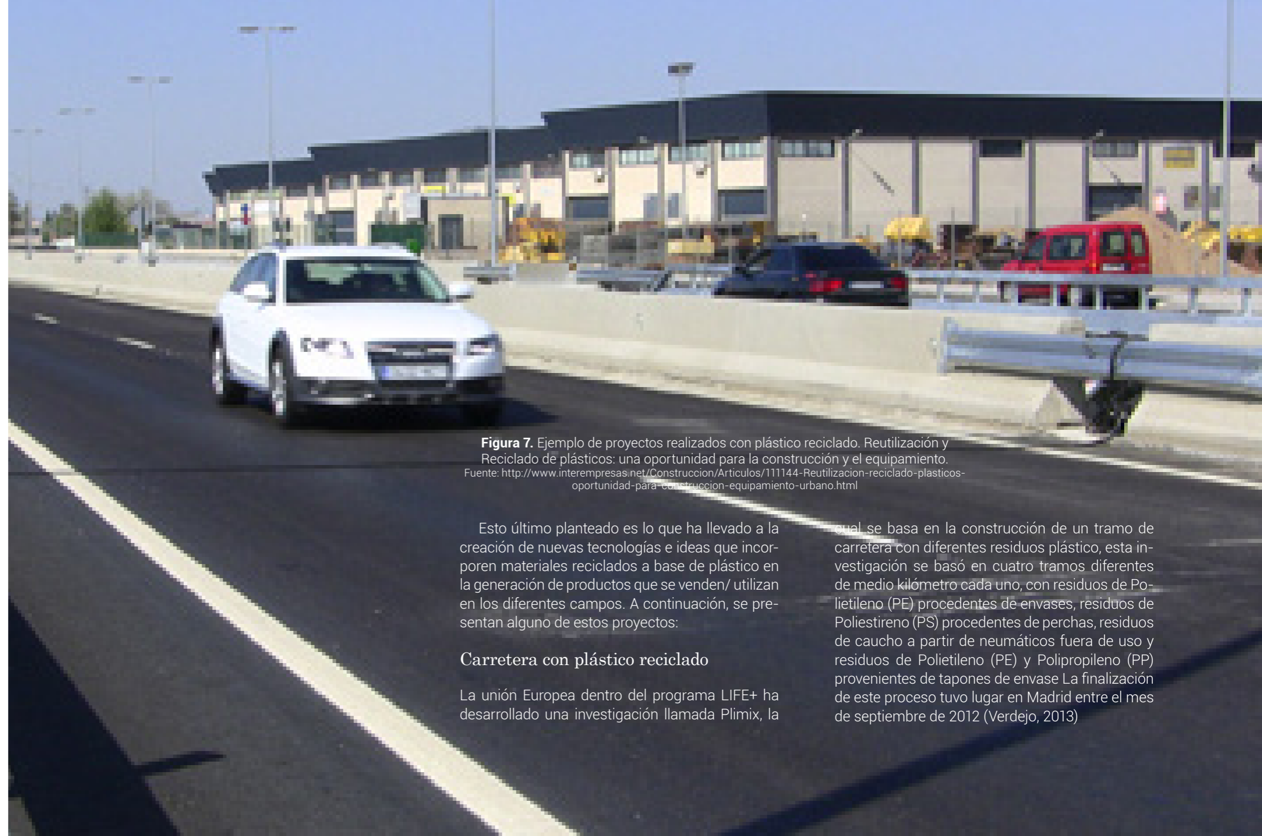
Figura 7. Ejemplo de proyectos realizados con plástico reciclado. Reutilización y Reciclado de plásticos: una oportunidad para la construcción y el equipamiento.

Esto último planteado es lo que ha llevado a la creación de nuevas tecnologías e ideas que incorporen materiales reciclados a base de plástico en la generación de productos que se venden/ utilizan en los diferentes campos. A continuación, se presentan alguno de estos proyectos: