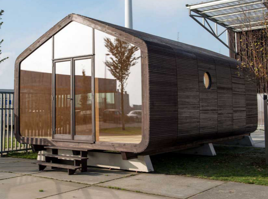
Figura 12. Casa construida con cartón reciclado.