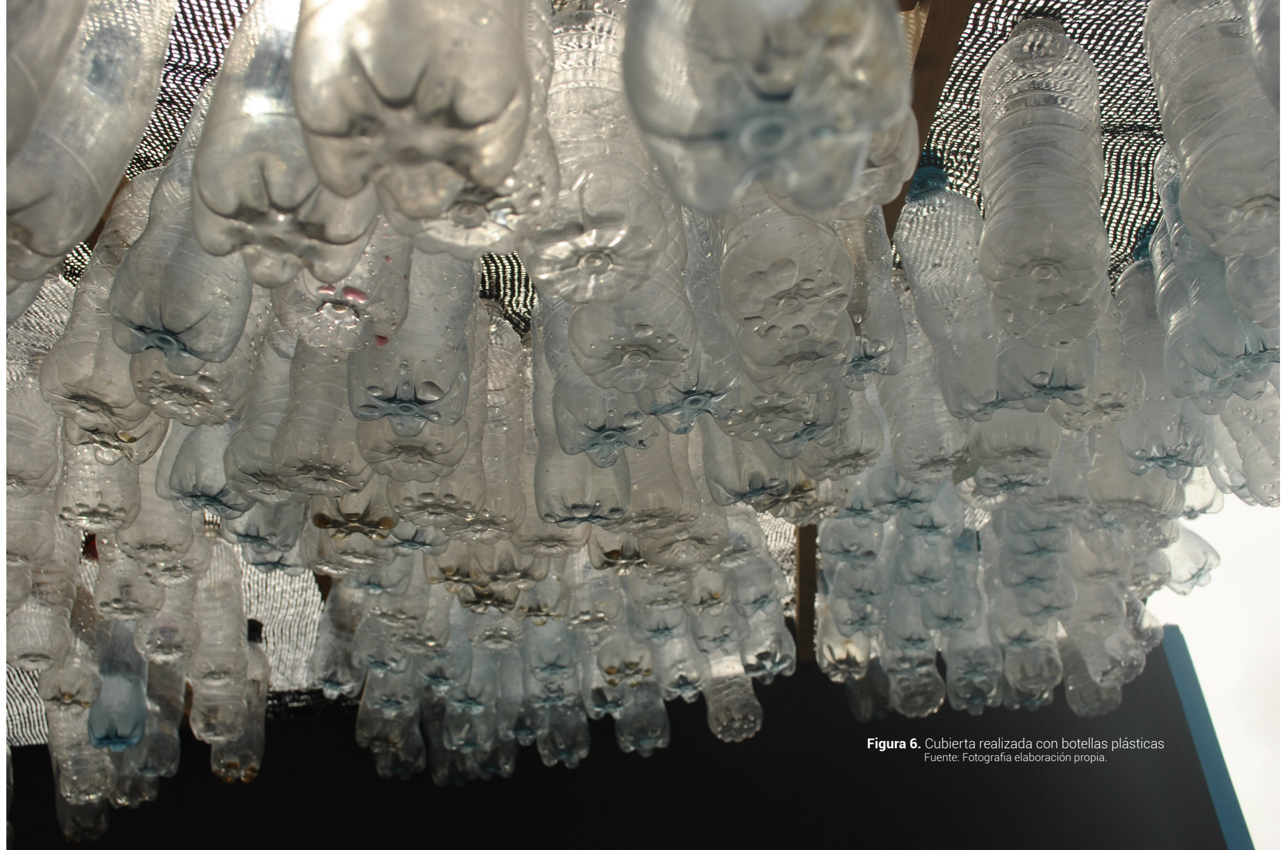
Figura 6. Cubierta realizada con botellas plásticas

El plástico o los llamados polímeros son cadenas largas de pequeñas moléculas repetidas, las cuales poseen unas características únicas que permiten una diversidad de aplicaciones a nivel