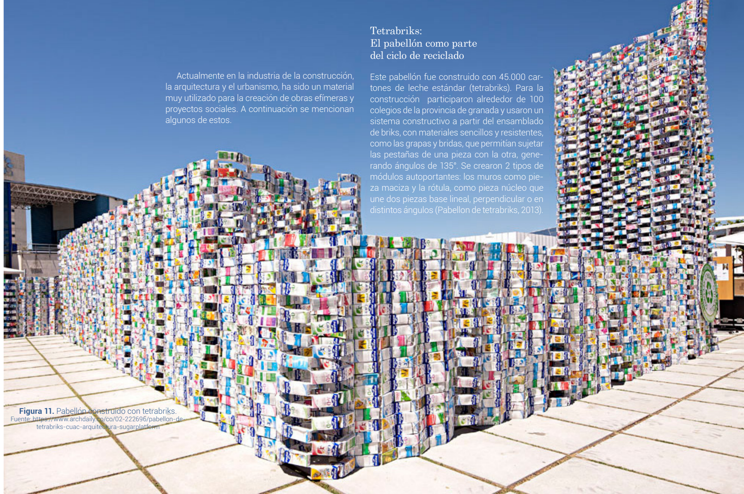
Figura 11. Pabellón construido con tetrabriks.

Este pabellón fue construido con 45.000 cartones de leche estándar (tetrabriks). Para la construcción participaron alrededor de 100 colegios de la provincia de granada y usaron un sistema constructivo a partir del ensamblado de briks, con materiales sencillos y resistentes, como las grapas y bridas, que permitían sujetar las pestañas de una pieza con la otra, generando ángulos de 135°. Se crearon 2 tipos de módulos autoportantes: los muros como pieza maciza y la rótula, como pieza núcleo que une dos piezas base lineal, perpendicular o en distintos ángulos (Pabellon de tetrabriks, 2013).