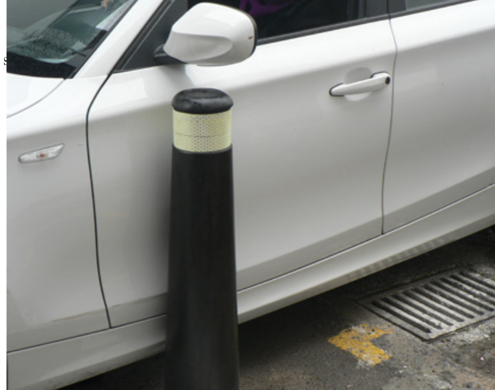
Figura 9. Bolardo hecho con plástico reciclado.