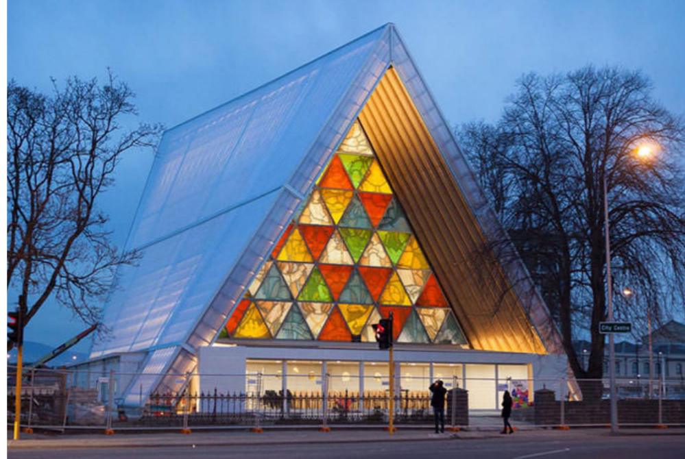
Figura 13. Catedral de Cartón.

Esta casa posee una estructura de cartón la cual se construye sobre un chasis de metal que va dando vueltas mientras capa a capa de láminas de cartón se depositan para obtener el molde que define la forma de la vivienda. Debido a su estructura tipo sándwich robusta ofrece óptimas cualidades de aislamiento y sobretodo cumple con la filosofía de la actualidad: reciclar, el exterior posee una capa de impermeabilizante que cubre toda la forma, desde el techo hasta la base, su estructura es extremada-