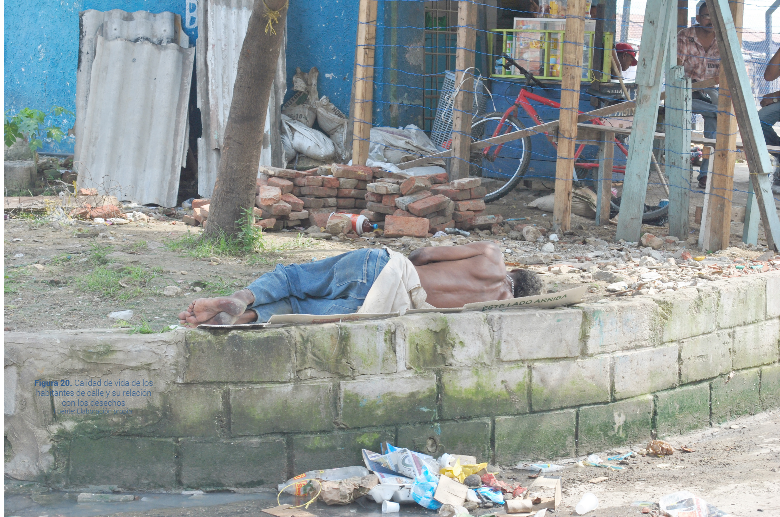
Figura 20. Calidad de vida de los habitantes de calle y su relación con los desechos

Cada una de nuestras actividades promueve la generación de residuos, es una acción imposible de modificar en el ser humano, pero en lo que sí es posible cambiar es la forma de mirar estos elementos "inservibles" como materiales con desempeño óptimo y costo asequible en el área de la arquitectura, construcción y sobre todo en la cotidianidad de nuestras vidas, basados principalmente en la filosofía de extraer menos y generar menores cantidades de residuos para la confección de buenos materiales de construcción (Bedoya, 2015).