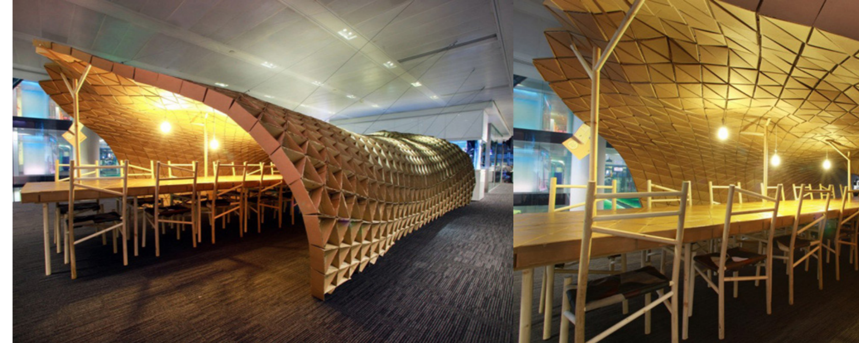
Figura 14. Pupa, pabellón de cartón de Liam Hopkins para Bloomberg.

Una catedral que surgió como respuesta a un terremoto en febrero de 2011 el cual azotó a la ciudad de