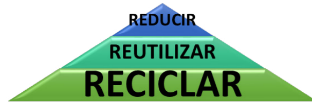
Figura 17. Triángulo Ecológico. Fuente: Elaboración propia.

Además de esto, la reutilización de los desechos como materia prima en el área de la construcción y como alternativa para mejorar la calidad de vida de las personas debe estar basada en tres pilares fundamentales que ayudan a mantener un desarrollo sostenible eficiente y coherente como el económico, social y ecológico; pero donde la capacidad de mantener ese equilibrio involucra cuatro componentes más: política, ideológica y cultural, educativa e institucional, estos permiten la viabilidad de los procesos sostenibles y el éxito de práctica innovadoras que involucran la segunda vida de los materiales (Páez, 2015).