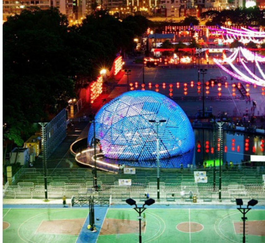
Figura 10. 7 Mil botellas recicladas dan forma a un pabellón en Hong Kong.