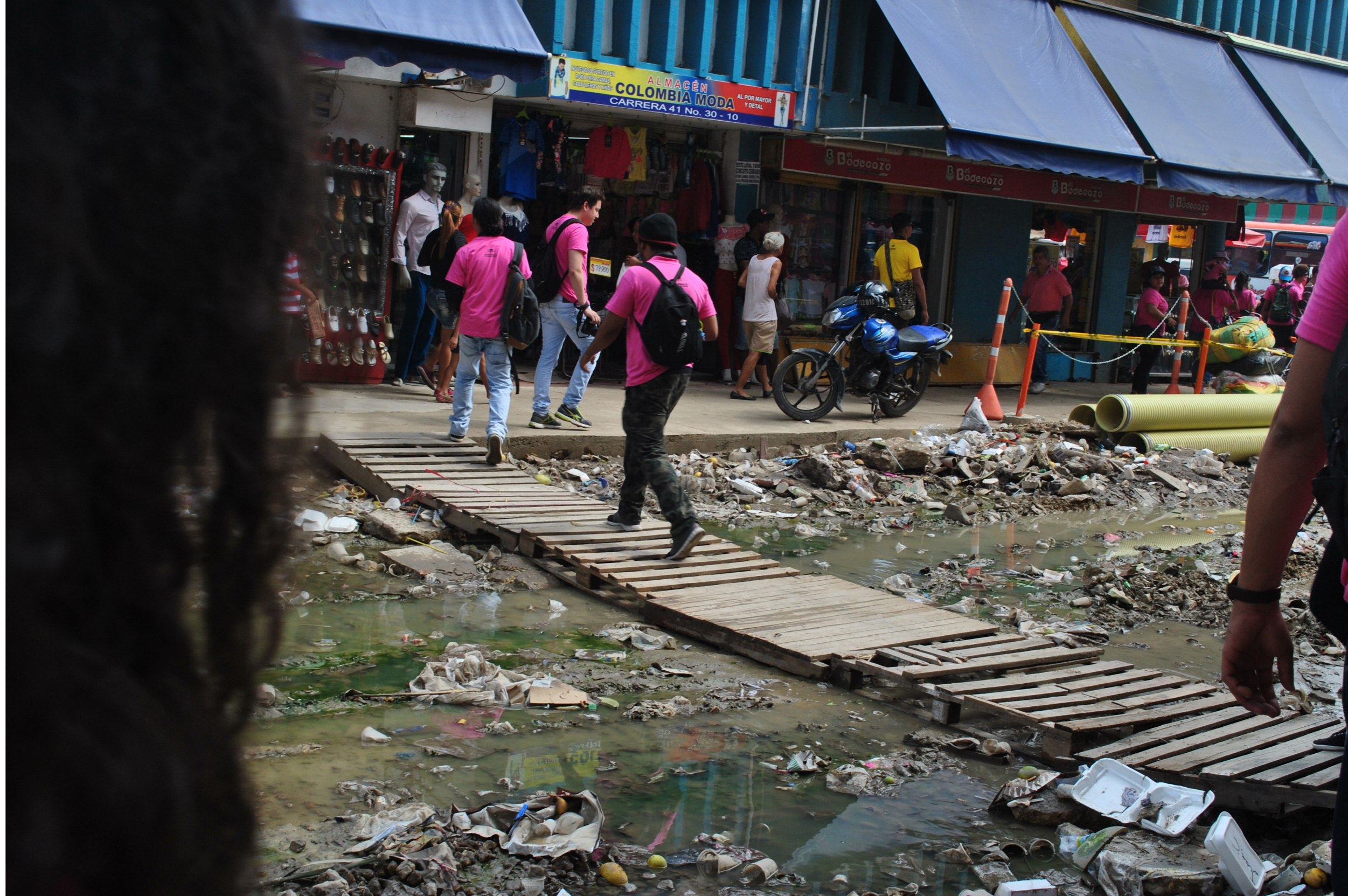
Figura 18. Afectación de la movilidad por residuos generados en espacios de construcción.

Además de esto, la reutilización de los desechos como materia prima en el área de la construcción y como alternativa para mejorar la calidad de vida de las personas debe estar basada en tres pilares fundamentales que ayudan a mantener un desarrollo sostenible eficiente y coherente como el económico, social y ecológico; pero donde la capacidad de mantener ese equilibrio involucra cuatro componentes más: política, ideológica y cultural, educativa e institucional, estos permiten la viabilidad de los procesos sostenibles y el éxito de práctica innovadoras que involucran la segunda vida de los materiales (Páez, 2015).