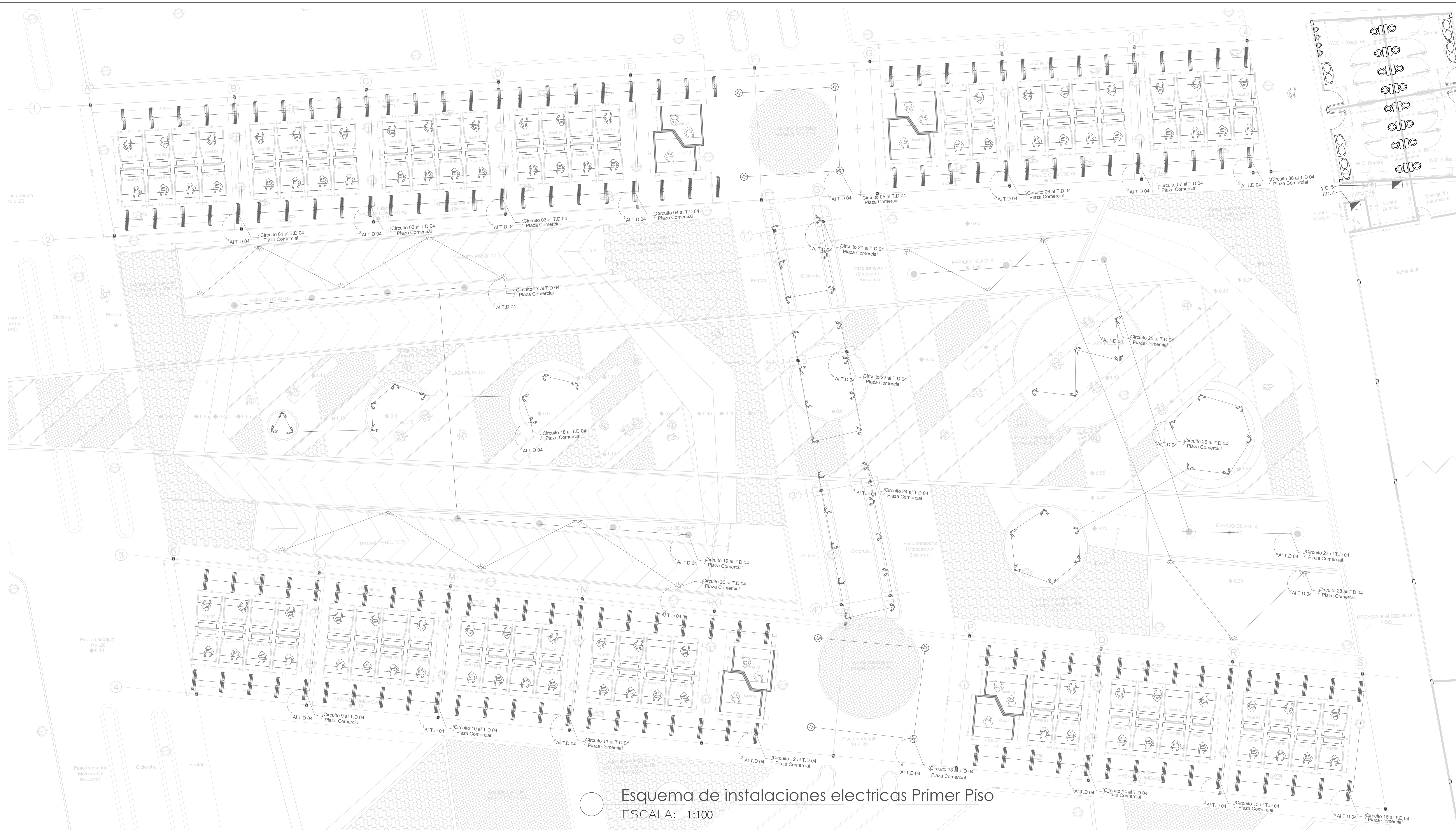
Esquema de instalaciones electricas Primer Piso ESCALA: 1:100