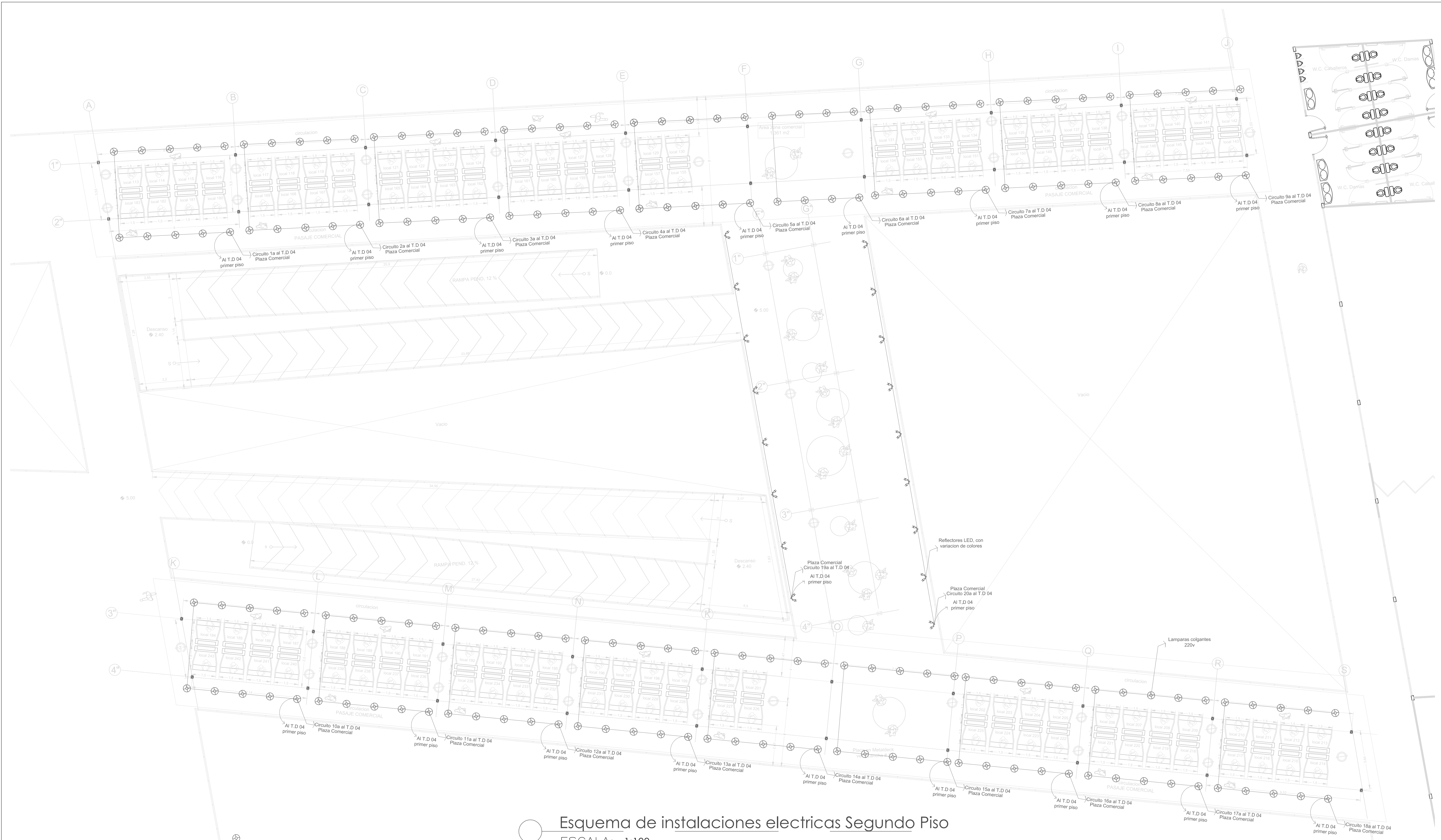
Esquema de instalaciones electricas Segundo Piso ESCALA: 1:100