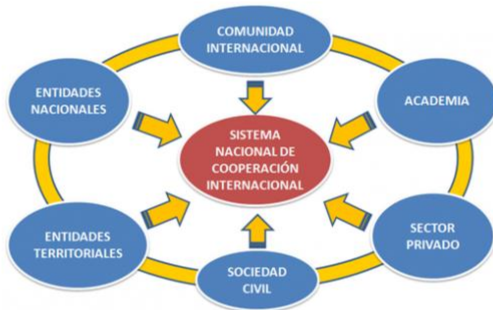
Figura 3. Sistema Nacional de Cooperación Internacional