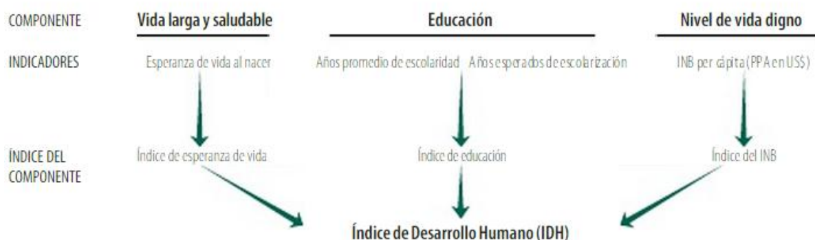
Figura 1. Componentes del Índice de Desarrollo Humano

Es precisamente a partir de la compilación de estos enfoques y con el ánimo de cuantificar el desarrollo humano de los distintos países, que el PNUD crea un nuevo indicador de nombre Índice de Desarrollo Humano (IDH), el cual toma en cuenta aspectos no económicos permitiendo medir el desarrollo de manera integral e identificar aquellos países receptores de ayuda.