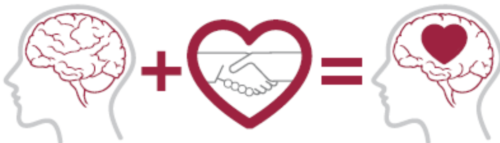
Figura 6. Management Case