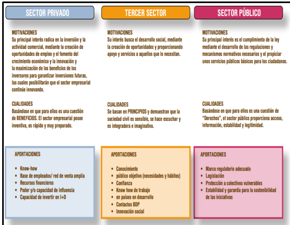
Figura 7. Relación entre Actores APPD

Público; de Beneficios para el Sector Privado; y de Principios para el Tercer Sector, tal cual se describe en el gráfico: