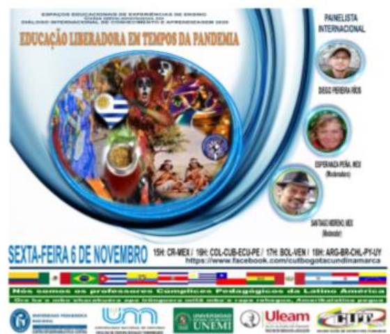
Galería de fotos 2.