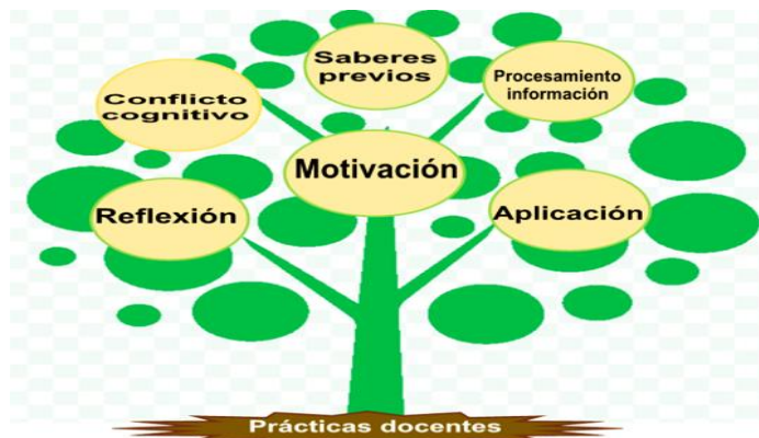
Figura 1 Infograma.