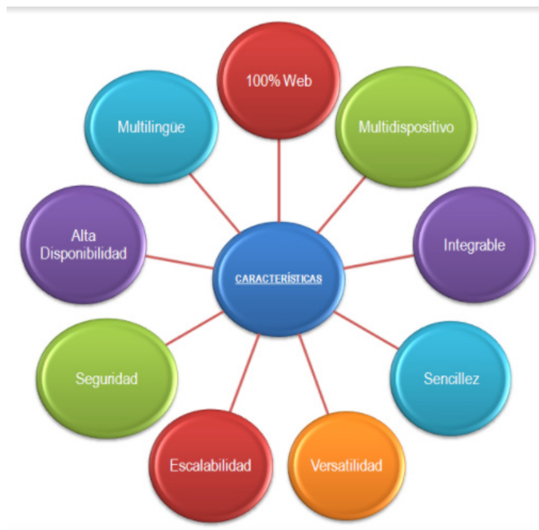
Fig. 1. Características del software.

De esta manera debe contar con unas características intrínsecas y extrínsecas que lo hagan llamativo al usuario y por tanto tenga éxito en el mercado, estas características pueden denominarse operativas. Siendo aquellas que aluden a los factores de funcionalidad, es decir, la parte externa, dentro de las cuales podemos mencionar la corrección, la usabilidad, la integralidad, la fiabilidad, la eficiencia y la seguridad. Por otro lado se le atribuyen las características de transición vinculadas con la escalabilidad o la interconexión con otro software, como lo son la interoperabilidad y la reutilización. Finalmente encontramos las características de revisión, entre las cuales encontramos la capacidad de mantenimiento, flexibilidad, escalabilidad, capacidad de prueba y modularidad [2] (Fig. 1).