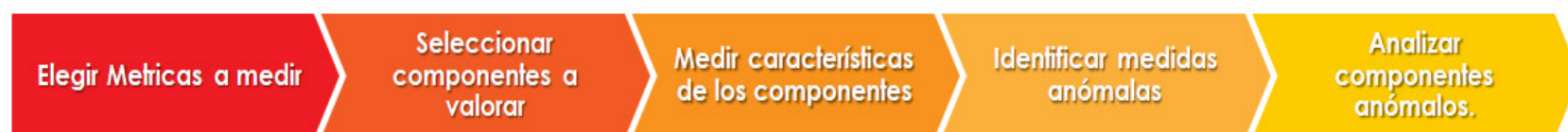
Fig. 2. Proceso de medición definido por Sommerville.

De la misma manera, se afirma que la medición es una actividad que forma parte de un proceso (Fig. 2), el cual consiste en asociar valores numéricos a atributos de productos o procesos de software [6].