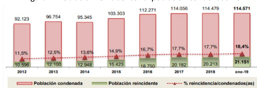
Figura 1- Población reincidente vs. población condenada 2012 - 2019

Fuente: Inpec, Informe estadístico enero 2019