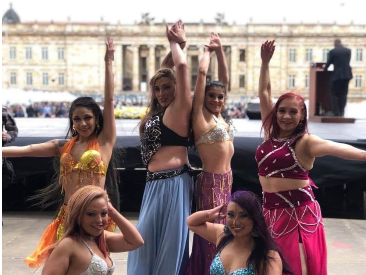
Figura 3 - Presentación Expotalentos 2019 danza árabe