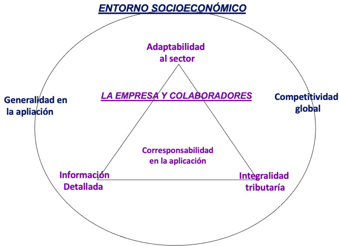
Figura 1. Cualidades de la contabilidad bajo NIIF en PyMEs.